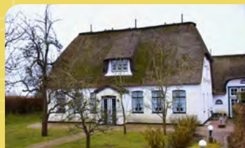
Geburtshaus Gustav Jenners im Keitumer Gurtstig (2019)

»Zwei sind besser daran als einer und eine dreifache Schnur zereißt nicht so schnell.«